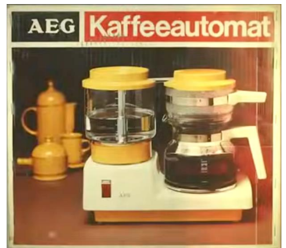
Plakat der 50er Jahre.